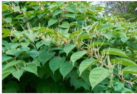
La renouée du Japon

https://www.valbirse.ch/1006-actualites-actualites